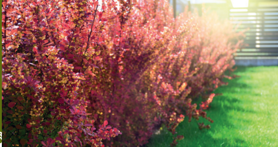
En lækker Berberishäck i höstskrud.